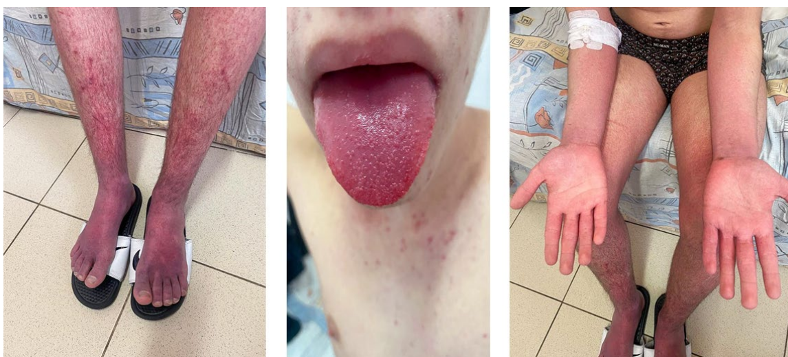
Рис. 1-3 (1,3 – синдром экзантемы, 2 – «малиновый язык»)